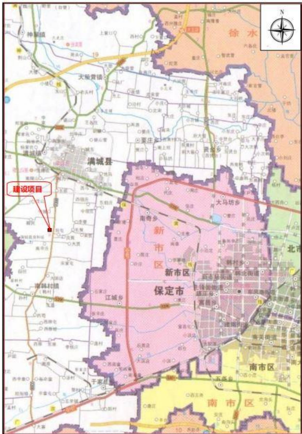
图 1-1 周边环境图