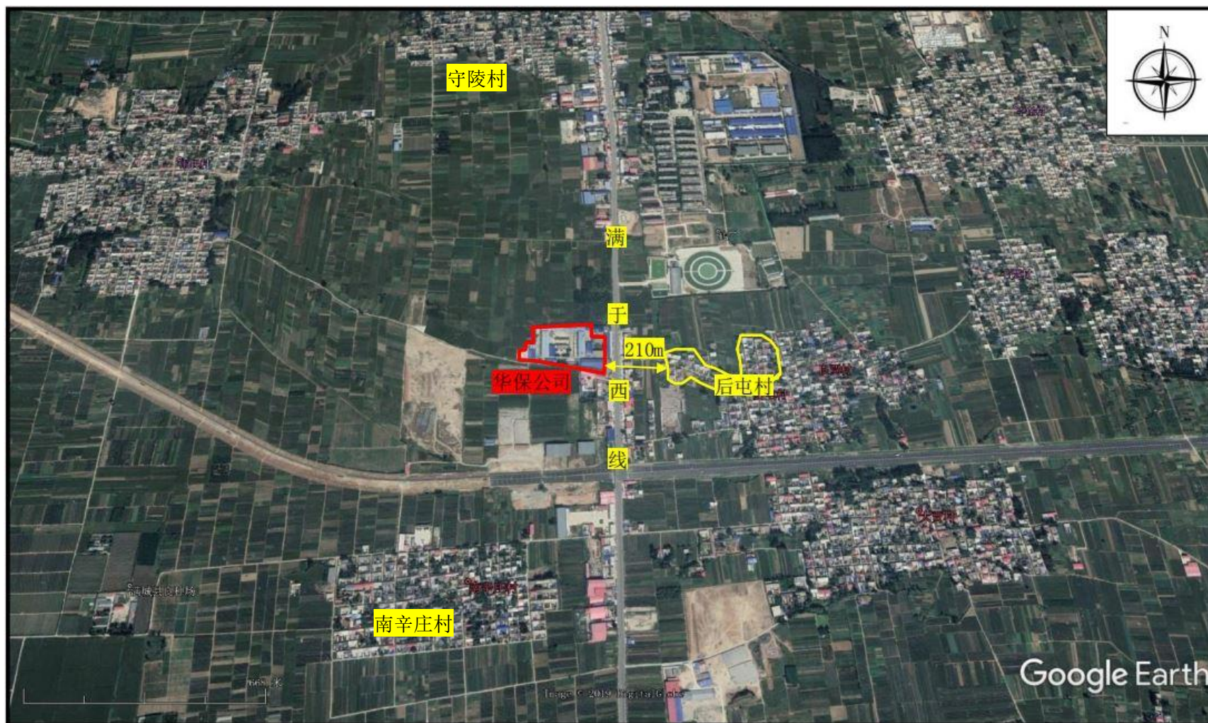
图 1-3 周边环境图